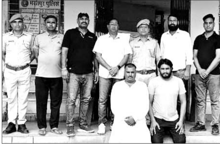
एंटी गैंगस्टर टास्क फोर्स पुलिस मुख्यालय की टीम ने दो आरोपियों को पकड़ा।