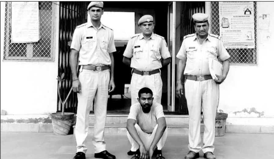
पचेरी कलां पुलिस ने बिजली के तार चोरी के मामले में एक आरोपी को गिरफ्तार किया।

खेतड़ी, (निर्स)। पचेरी कलां पुलिस ने सोमवार देर शाम को खेतड़ी से नरेला जा रही हाईटेंशन बिजली सप्लाय लाइन के तार चोरी के मामले में एक आरोपी को गिरफ्तार किया। आरोपी हरियाणा का रहने वाला है जिसने अपने साथियों के साथ मिलकर दो महीने पहले बिजली के तार चोरी कर लिए थे।