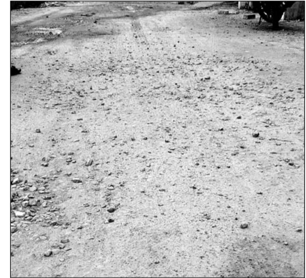
सुजानगढ़ में कंकरीट में तब्दील हुई नवनिर्मित सड़क।