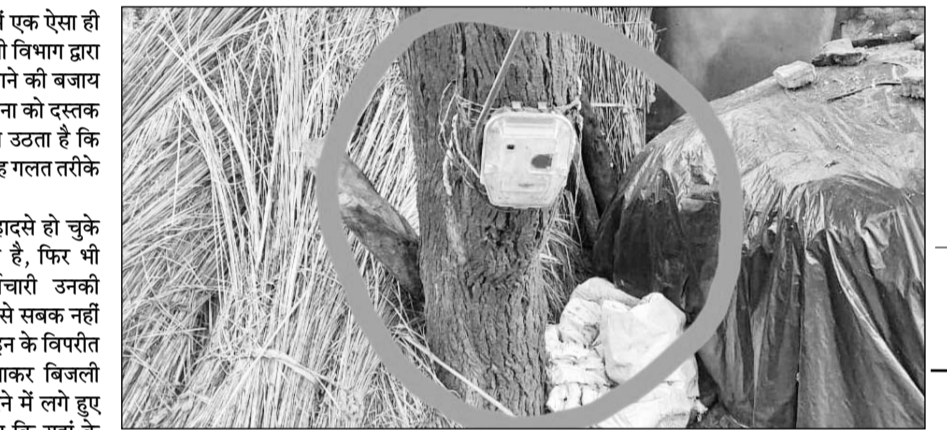
बामनवास के फुलवाड़ा ग्राम में पेड़ पर बंधा बिजली का मीटर।