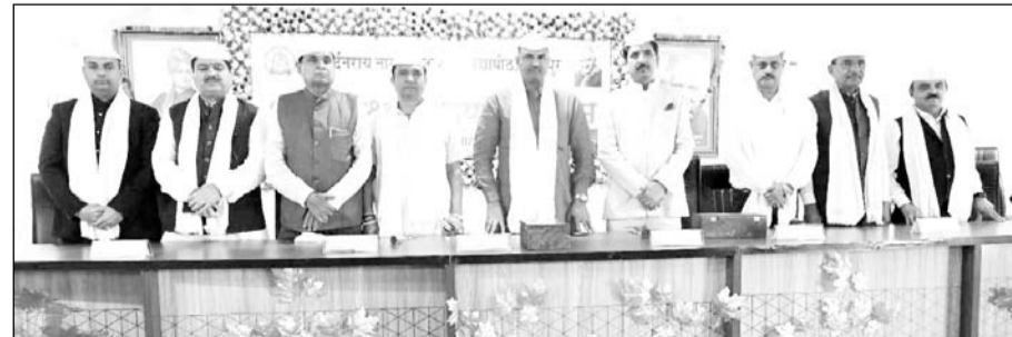
जनार्दनराय नागर राजस्थान विद्यापीठ के स्थापना दिवस के अवसर पर उपस्थित अतिथिगण।