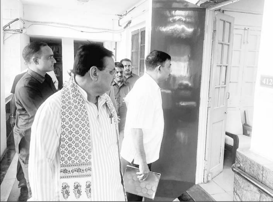
मुख्यमंत्री भजनलाल शर्मा ने मंगलवार को सुबह अचानक सचिवालय की मुख्य बिल्डिंग में निरीक्षण करने के लिए पहुंच गए। इस दौरान सी.एम.ने सचिवालय के मुख्य भवन में करीब 10 मिनट बिताए।