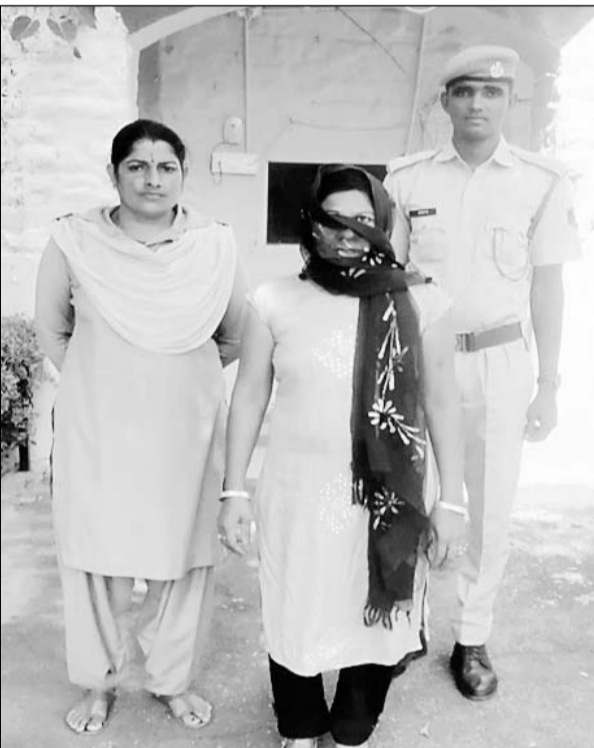
शाहजहांपुर थाना पुलिस ने फ्रॉड महिला को गिरफ्तार किया।