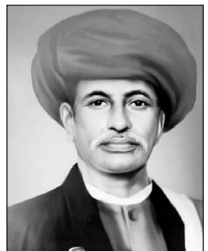
महात्मा ज्योतिबा फुले

हवा। असल में वर्ष 1848 में उनके साथ एक ऐसी घटना घटी जिसने उन्हें झकझोर दिया। वह अपने एक मित्र के विवाह में शामिल होने के लिए गए थे। मित्र उच्च कुल का था और विवाह समारोह में उनके साथ अपमानित व्यवहार हुआ। उन्होंने तभी तय कर लिया जाति व्यवस्था की इस कुप्रथा को वह जड़ से समाप्त करेंगे। यही बाद में हुआ भी। उन्होंने शुरुआत कहीं और से नहीं अपने ही घर से की। दलितों को अपने घर के कुएं को प्रयोग करने की अनुमति दे दी। दलितों और महिलाओं में अंधविश्वास के कारण उत्पन्न हुई आर्थिक और सामाजिक विसंगतियों को दूर करने के लिए भी उन्होंने आंदोलन चलाया। उनका मानना था कि यदि आजादी, समानता, मानवता, आर्थिक न्याय, शोषणरहित मूल्यों और भाईचारे पर आधारित सामाजिक व्यवस्था का निर्माण करना है तो असमान और शोषक समाज को उखाड़ फेंकना होगा। ज्योतिबा फुले युग से आगे की सोच रखते थे, इसीलिए महिला