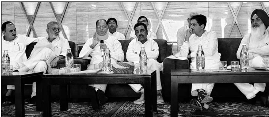
भादरा में जन स्वास्थ्य अभियांत्रिकी एवं भू-जल विभाग मंत्री कन्हैयालाल चौधरी ने विभागीय समीक्षा बैठक को संबोधित किया।

जन स्वास्थ्य अभियांत्रिकी एवं भू-जल विभाग के कैबिनेट मंत्री कन्हैयालाल चौधरी ने शनिवार को जिले के भादरा ब्लॉक में आयोजित समीक्षा बैठक में संबोधित करते हुए यह बात कही। चौधरी ने भादरा स्थित मोती पैलेस में श्रीगंगानगर, हनुमानगढ़ एवं अनुपगढ़ जिले के पीएचडी अधिकारियों की विभागीय समीक्षा बैठक ली। मंत्री कन्हैयालाल चौधरी ने कहा कि जनता मालिक है तथा जनता का ही पैसा है, इसका सदुपयोग बहुत जरूरी है। प्रदेश सरकार भ्रष्टाचार के विरुद्ध जीरो टॉलरेंस की नीति पर कार्य कर रही है। पिलानी में पीएचडी के अधिकारियों की बैठक ली गई। कार्य में कोताही बरतने वाले 2 जेईएन व 1 एईएन को तुरंत निलंबित किया गया था। उन्होंने सख्त लहजे में कहा कि अगर यहां भी अधिकारी कोताही बरतेंगे, तो