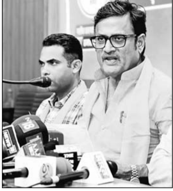
नेता प्रतिपक्ष राजेन्द्र राठौड़

-कार्यालय संवाददाता- जयपुर। नेता प्रतिपक्ष राजेन्द्र राठौड़ ने भाजपा प्रदेश कार्यालय में मंगलवार को लंपी वायरस, किसान कर्जमाफी और ओल्ड पेंशन स्कीम पर प्रेसवार्ता को संबोधित किया। इस दौरान राजेन्द्र राठौड़ ने गहलोल सरकार की बजट घोषणा में लंपी वायरस से मरने वाले गौवंश के मालिक पशुपालकों को 40 हजार रूपए मुआवजा देने में और गोशाला प्रबंधकों से वादाखिलाफी के आरोप लगाए। उन्होंने कहा कि लंपी रोग से मृत गौवंश का सरकारी आंकड़ा 76 हजार है, लेकिन मुआवजा मात्र 42 हजार को दे रहे हैं, गौशालाएं अब भी वंचित हैं।