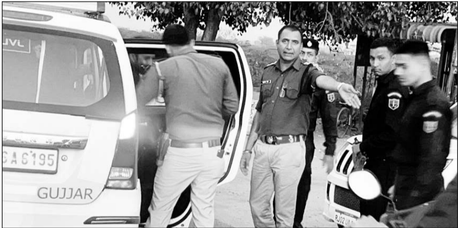
बहरोड़ पुलिस ने हरियाणा के दोनों बॉर्डर पर नाकाबंदी के दौरान वाहनों की जांच की।