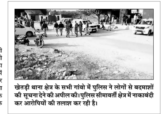
खेतड़ी थाना क्षेत्र के सभी गांवों में पुलिस ने लोगों से बंदमाशों की सूचना देने की अपील की। पुलिस सीमावर्ती क्षेत्र में नाकाबंदी कर आरोपियों की तलाश कर रही है।

की सघन जांच की जा रही है। ए श्रेणी की नाकेबंदी में बिना जांच के किसी भी वाहन को गुजरने नहीं दिया जा रहा है। नागौर जिले के सभी थाना क्षेत्रों में यह सघन नाकेबंदी की गई है और संदिग्ध लोगों से पूछताछ भी की जा रही है। इस दौरान मुक्त की बेटों के लिए कोचिंग संस्थान ने निशुल्क कोचिंग की घोषणा की है।