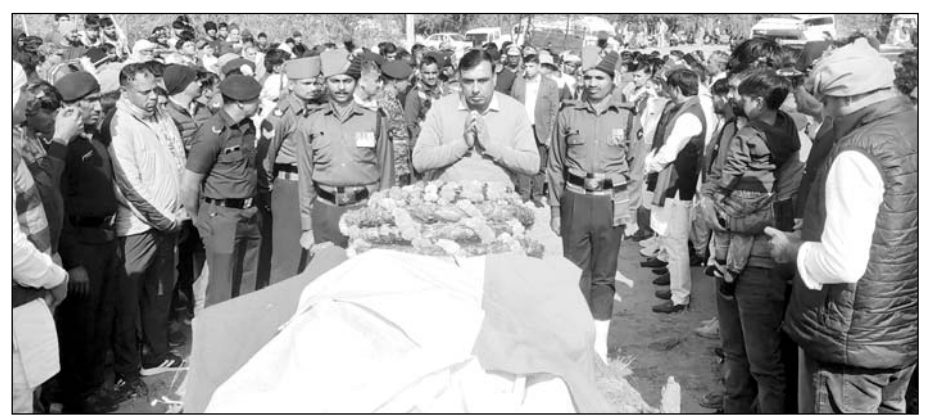
खेतड़ी के जवान का ब्रेन हैमरेज से निधन हो गया जिसकी पैतृक गांव में सैन्य सम्मान से अंत्येष्टि की गई।

खेतड़ी, (निसं)। खेतड़ी उपखंड के राजोता पंचायत की ढाणी लगरियावाली निवासी सेना के जवान का ब्रेन हैमरेज होने से निधन हो गया।