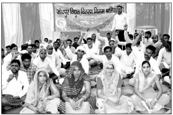
ओल्ड पेंशन स्कीम के आदेशों में आंशिक सुधार को लेकर विद्युतकर्मियों ने धरना दिया।