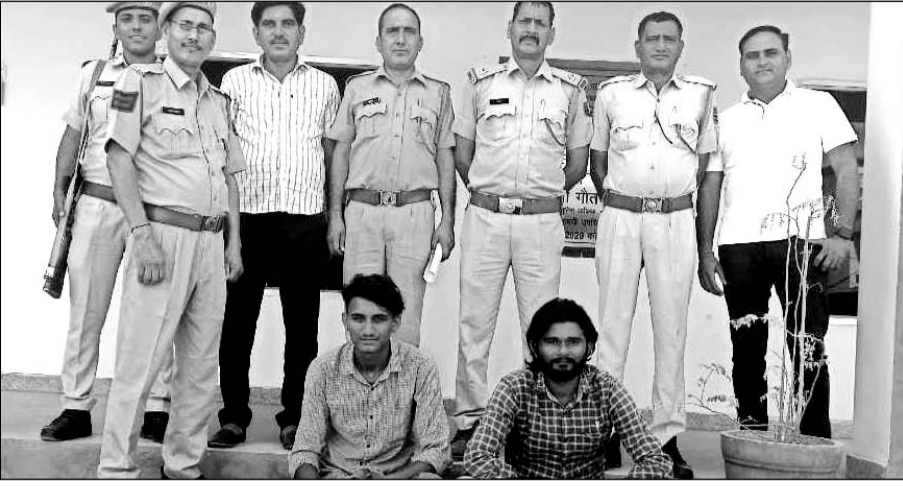
अवैध शराब तस्करी कर पंजाब से गुजरात ले जाते गिरफ्तार आरोपीगण।