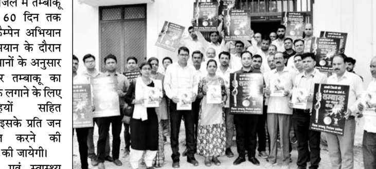
चूरू में तम्बाकू मुक्ति एवं इसके प्रभाव विषय पर पेंटिंग एवं स्लोगन, यूथ सेलफ़ी प्रतियोगिता आदि गतिविधियों की जानकारी दी गई।