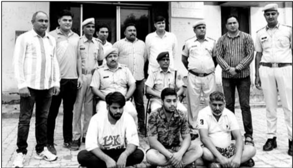
पुलिस ने हत्या के मुख्य आरोपियों को गिरफ्तार किया।