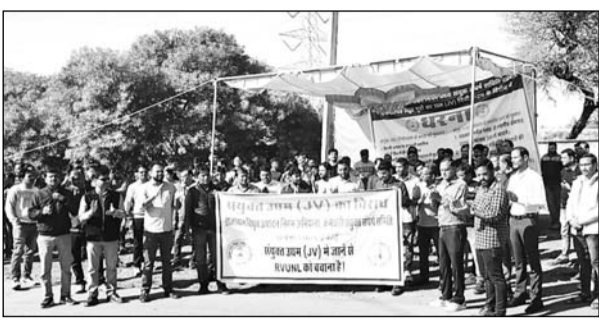
छबड़ा थर्मल में निजीकरण के खिलाफ आक्रोश जताया।

छबड़ा (निर्सं)। थर्मल में पिछले 104 दिनों से चल रहे ज्वाइंट वेंचर के विरोध प्रदर्शन का आक्रोश बढ़ता ही जा रहा है परंतु, सरकार ओर विद्युत प्रशाशन आंख मूंद कर बैठे है।