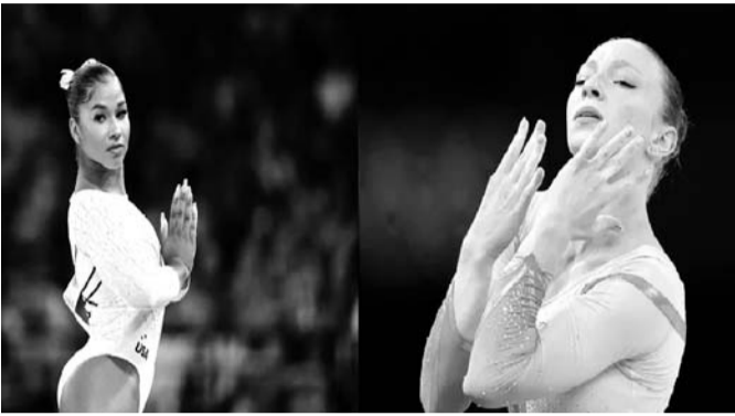
रोमानिया की जिम्नास्ट एना बारबोसु को इवेंट में एना ने हारकर भी ब्रॉन्ज मेडल जीत अच्ची खबर दी है। जिम्नास्टिक के फ्लोर

नई दिल्ली, 11 अगस्त। पेरिस ओलंपिक 2024 शुरू से ही किसी ना किसी कारण चर्चा में रहा। वहीं ओलंपिक 2024 में भारतीय स्तर रेसलर विनेश फोगाट को 100 ग्राम ज्यादा वजन होने के कारण फाइनल से बाहर कर दिया गया था। ऐसे में उनसे मेडल छिन गया जिसके बाद विनेश ने कोर्ट ऑफ आर्बिट्रेशन फॉर स्पोर्ट्स में केस किया, जिसकी सुनवाई हो चुकी है लेकिन फैसला आने में अभी भी समय लगेगा। दरअसल, सीएएस ने पहले फैसला 11 अगस्त के लिए टाला था जिसके बाद एक बार फिर फैसला टालते हुए 13 अगस्त का दिन फैसले के लिए तय किया गया है। लेकिन इससे पहले ने