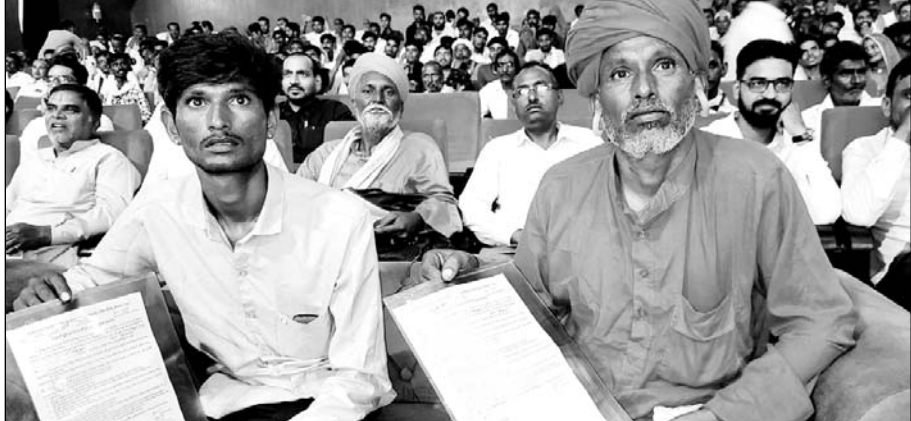
बीकानेर में रविन्द्र रंगमंच पर आयोजित जिला स्तरीय कार्यक्रम में विमुक्त, घुमंतू एवं अर्द्ध घुमंतू आवासहीन व्यक्तियों को पट्टे वितरित किए।

मुख्यमंत्री ने बीकानेर के मनफूल नाथ से वीडियो कॉन्फ्रेंस के जरिए संवाद