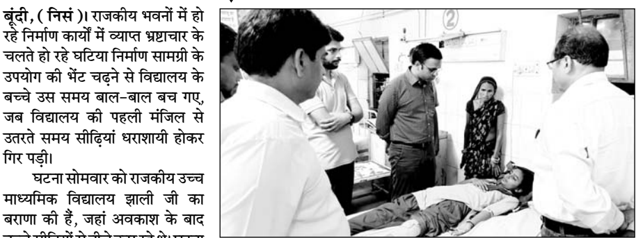
कलेक्टर ने अस्पताल पहुंच कर घायल छात्राओं की कुशलक्षेम पूछी।

बूंदी, (निर्स)। राजकीय भवनों में हो रहे निर्माण कार्यों में व्याप्त भ्रष्टाचार के चलते हो रहे घटिया निर्माण सामग्री के उपयोग की भेंट चढ़ने से विद्यालय के बच्चे उस समय बाल-बाल बच गए, जब विद्यालय की पहली मंजिल से उतरते समय सीढ़ियां धराशायी होकर गिर पड़ीं।