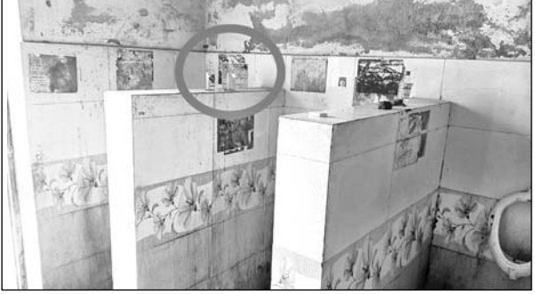
सांभर के पांच बत्ती चौराहे पर बने सुलभ शौचालय में जमा गंदगी व रखी शराब की बोतलें।