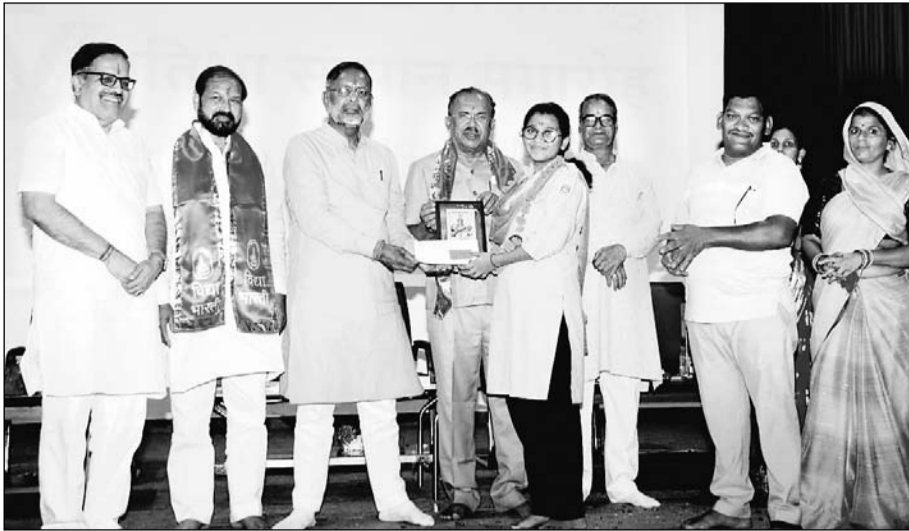
विधानसभाध्यक्ष वासुदेव देवनानी रिवार को कोटा में विद्या भारती शिक्षा संस्थान के प्रतिभा सम्मान समारोह को मुख्य अतिथि के रूप में संबोधित किया।

जयपुर। विधानसभा अध्यक्ष वासुदेव देवनानी ने कहा कि समाज में परिवर्तन लाने के लिए नई पीढ़ी को संस्कारवान बनाना हम सभी की जिम्मेदारी है। नई पीढ़ी को राष्ट्रीयता, देश प्रेम एवं मूल्यों की शिक्षा देकर उनमें देश के लिए समर्पण का भाव उत्पन्न कर हम 2047 तक विकसित भारत का संकल्प पूरा कर सकेंगे। देवनानी रिवार को कोटा में विद्या भारती शिक्षा संस्थान के प्रतिभा सम्मान समारोह को मुख्य अतिथि के रूप में संबोधित कर रहे थे।