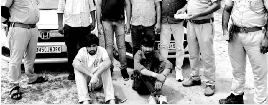
रामनगरिया पुलिस ने फिरौती के लिए 3 युवकों का अपहरण करने वाले दो बदमाशों को गिरफ्तार किया।