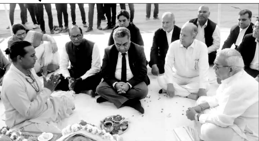
मुख्य न्यायाधीश एम.एम. श्रीवास्तव बुधवार को फैमिली कोर्ट के अलग भवन के लिए आयोजित भूमि पूजन समारोह में शामिल हुए।

सीजे श्रीवास्तव ने कहा कि वर्तमान में फैमिली विवाद के प्रकरण बढ़ रहे हैं। इसलिए अदालतों की संख्या भी बढ़ रही है। इसलिए कोर्ट के भवन का निर्माण भी