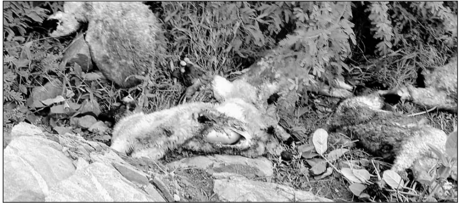
पंचायत महावा की ढाणी निचली में मृत पड़ी भेड़ें।