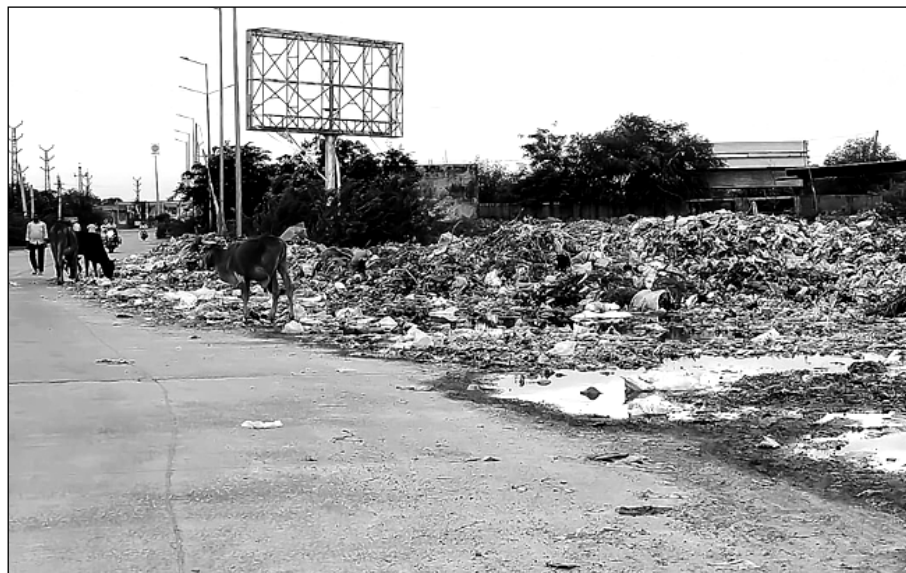
मालपुरा शहर के अजमेर रोड पर मुख्य सड़क किनारे करोड़ों रूपये की बेसकिमती जमीन पर कचरा डाला जा रहा है।

शहर के 35 वार्डों से प्रतिदिन दर्जनों ऑटोकीपर व ट्रैक्टरों के माध्यम से कचरा संग्रह कर टोडारोड के पास कल्याणपुरा रोड पर पालिका की तकर्रीबन 20 बीघा जमीन पर आर्क्षित डम्पिंग यार्ड में कचरा डालने का प्रावधान है, लेकिन सफाई ठेकेदार निश्चित स्थान पर कचरे को डालने के बजाय भूमाफियाओं से मिलकर मुख्य सड़क किनारे कचरे के ढेर लगा गड़ुओं में तब्दील जमीन का समतलीकरण करने में अपनी महत्वपूर्ण भूमिका निभा रहा है। सूत्रों की माने तो ऑटोकीपर व ट्रैक्टरों में डीजल की खपत उतनी ही दर्शाई जा रही है जितनी कल्याणपुरा रोड पर डम्पिंग