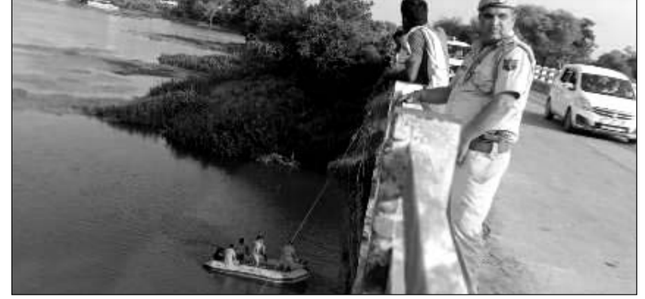
करौली के पांचना पुल के पानी में हथियार की तलाश करते पुलिसकर्मी।