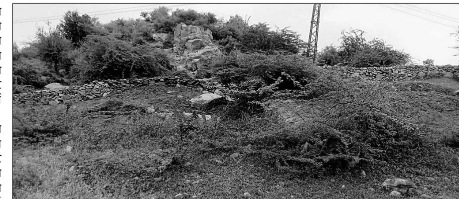
टोंक उपखण्ड के वन रेंज सोहेला में वृक्षारोपण सहित निर्माण कार्यो में धमका धांधली करने का मामला सामने आया है।

टोंक, (निसं)। टोंक उपखण्ड के वन रेंज सोहेला में वृक्षारोपण सहित निर्माण कार्य में धमका धांधली करने का मामला प्रकाश में आया है। प्राप्त जानकारी के अनुसार सोहेला वन क्षेत्र में बनी पुरानी दीवार को ही रंगरोगन कर नयी वॉल बताकर लाखों रूपये के फर्जी भुगतान उठाये गये हैं। सोहेला वन्य क्षेत्र में हर साल वन संरक्षण को लेकर प्लान्टेशन का निर्माण करवाया जाता है लेकिन वन अफसर नियमों को दरकिनार कर राशि का आहरण करते रहे हैं। ऐसी ही एक कहानी सोहेला वन नका क्षेत्र वैष्णो देवी प्लांटेशन में भारी भ्रष्टाचार देखने को मिल रही है। राष्ट्रीय राजमार्ग 52 पर स्थित वैष्णो देवी मंदिर के पास बनाए गए प्लांटेशन में भारी भ्रष्टाचार किया गया है। उक्त प्लांटेशन पर कई बार प्लांटेशन बनाए जा चुके हैं जबकि अफसरों द्वारा बार-बार नाम