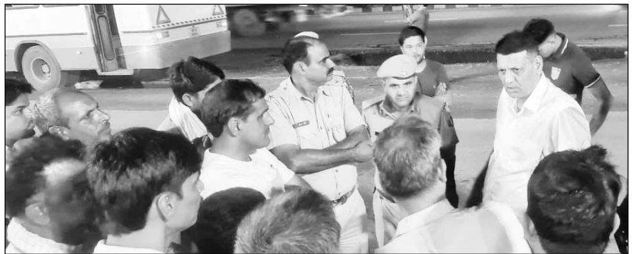
पुलिस ने मौके पर पहुंच मामले की जांच की।

पावटा, (नि.सं.)। हरियाणा रोडवेज की बस में बैठे लोग तब सहम गए, जब अचानक उन पर दो गाड़ियों में सवार लोगों ने हवाई फायरिंग व पत्थरवा शुरू कर दिया। दरअसल ओल्ड राव होटल के पास जयपुर से नारनौल जा रही हरियाणा रोडवेज की बस पर फाँचुनर व हेरियर गाड़ी में आए बदमाशों ने हवाई फायरिंग व पत्थरवा कर दिया और मौके से फरार हो गए।