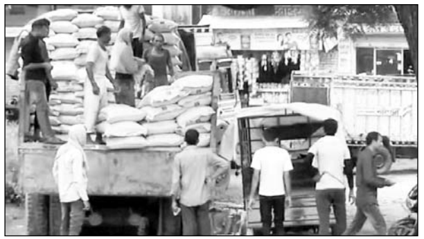
पावटा में खाद की रैक पहुंचने पर किसानों की भीड़ उमड़ी।