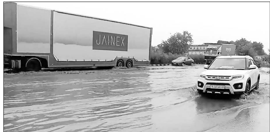
राष्ट्रीय राजमार्ग 48 पर बारिश मे भरा पानी।

पावटा, (नि.सं.)। राष्ट्रीय राजमार्ग 48 पर बरसात के पानी के भराव व उसकी निकासी नहीं होना एनएचआई अधिकारियों व प्रशासन की लापरवाही का नतीजा है। पावटा में बावडी मोड़ के पास मुख्य राष्ट्रीय राजमार्ग 48 पर बरसात का पानी जमा होने से राहगीरों, यात्रियों को भारी परेशानियों का सामना करना पड़ रहा है। प्राप्त जानकारी के अनुसार राष्ट्रीय राजमार्ग 48 पानी निकासी के लिए नाला तो बनवा दिया