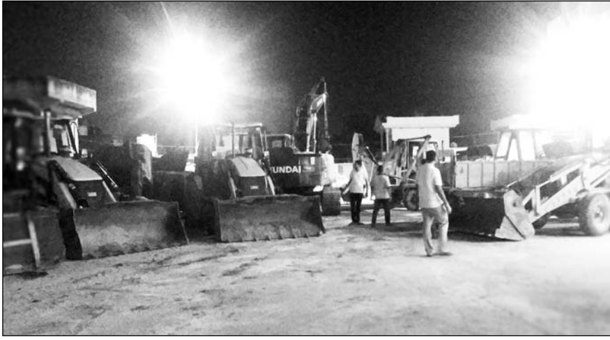
कोटपूतली में प्रशासन ने अतिक्रमण को चिह्नित कर मौके पर ट्रैक्टर व जेसीबी तैनात किए।

ज्ञापन में बताया कि नगर परिषद द्वारा 24 घण्टे में सामान हटाने एवं ध्वस्त संरचना हटाने के नोटिस जारी किये गये हैं जबकि 8 माह पूर्व भी इसी