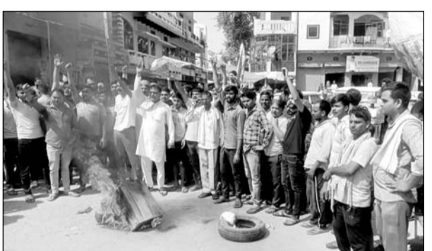
शिव परिवार की मूर्ति खंडित होने पर लोगों में आक्रोश फैल गया।

जुरहरा, (निसं)। कस्बे के प्राचीन चमत्कारी इंद्रकुटी हनुमान मंदिर पर स्थित शिव परिवार की मूर्तियों के सोमवार को खंडित कर देने के मामले में मंगलवार की सुबह कस्बे में विरोध मार्च निकाला गया।