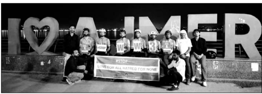
साइकिल यात्रियों के दल ने अजमेर में भी यात्रा निकाली।

अजमेर, (कासं)। वैश्विक शांति और पर्यावरणीय जिम्मेदारी को बढ़ावा देने के लिए निकाली जा रही साइकिल यात्रा मंगलवार को अजमेर पहुंची। यात्रा के अजमेर पहुंचने पर स्वागत किया गया। अजमेर के प्रमुख मार्गों पर यह यात्रा निकली। यह यात्रा अहमदिया मुस्लिम यूथ विंग की ओर से भारत में वैश्विक शांति और पर्यावरणीय जिम्मेदारी को बढ़ावा देने के लिए केरल से कादियान तक 3,600 किमी की साइकिल यात्रा शुरू की गई है।