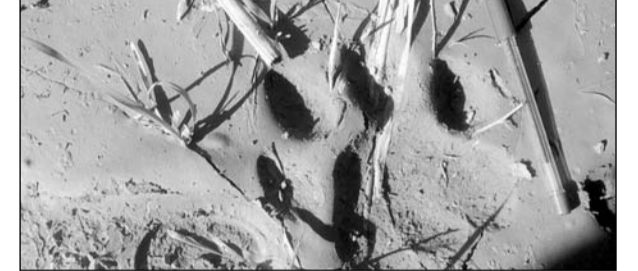
डांग क्षेत्र में मिले टाइगर के पगमार्क।

मासलपुर/करोली, (निसं)। मासलपुर के डांग क्षेत्र में टाइगर के आने से लोगों में दहशत फैल गई। वन विभाग की टीम ने टाइगर के पग मार्क लिए। मासलपुर बंद खंड के ज्ञानी का बेड़ा के पास टाइगर आने से क्षेत्र के लोगों में दहशत फैल गई। ज्ञात रहे गत 2 सप्ताह पहले भी