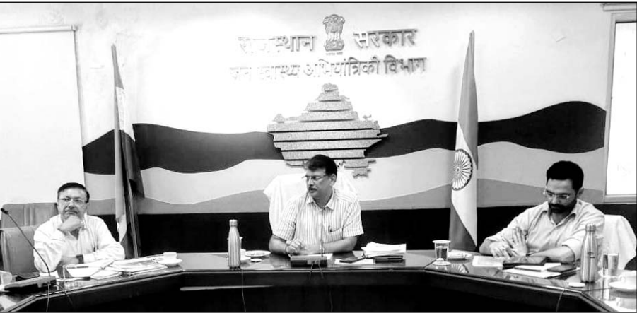
प्रमुख शासन सचिव भास्कर सावंत ने बुधवार को जल भवन में आयोजित जल जीवन मिशन कार्यों की प्रगति की समीक्षा बैठक के दौरान उपस्थित अधिकारियों को सम्बोधित किया।

जयपुर । प्रमुख शासन सचिव भास्कर ए. सावंत ने कहा कि जल जीवन मिशन के तहत जो कार्य आदेश जारी किये गये हैं, उनकी योजना-वार मॉनिटरिंग की जाए। साथ ही प्रत्येक स्तर पर समय सीमा निर्धारित की जाए। उन्होंने कहा कि