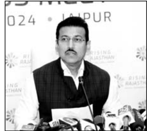
उद्योग एवं वाणिज्य मंत्री ने 'राइजिंग राजस्थान' ग्लोबल इन्वेस्टमेंट समिट 2024 से पहले मीडिया को संबोधित किया

जयपुर। मुख्यमंत्री भजन लाल शर्मा के नेतृत्व में इस वर्ष दिसंबर में जयपुर में आयोजित होने वाले 'राइजिंग राजस्थान' ग्लोबल इन्वेस्टमेंट समिट 2024 से पहले उद्योग एवं वाणिज्य मंत्री कर्नल राज्यवर्धन राठौड़ ने आज मीडिया को संबोधित किया। आज आयोजित प्रेस कॉन्फ्रेंस में माननीय मंत्री कर्नल राठौड़ ने कहा कि सरकार अगले पांच वर्षों में राज्य के सकल घरेलू उत्पाद को मौजूदा 15 लाख करोड़ रुपये से दोगुना करके 30 लाख करोड़ रुपये तक पहुंचाने का लक्ष्य लेकर चल रही है और 'राइजिंग राजस्थान' ग्लोबल इन्वेस्टमेंट समिट 2024 के जरिए प्रदेश में निवेश जुटाना सरकार की सर्वोच्च प्राथमिकता है। कर्नल राठौड़ ने यह भी कहा कि सरकार 'इज ऑफ