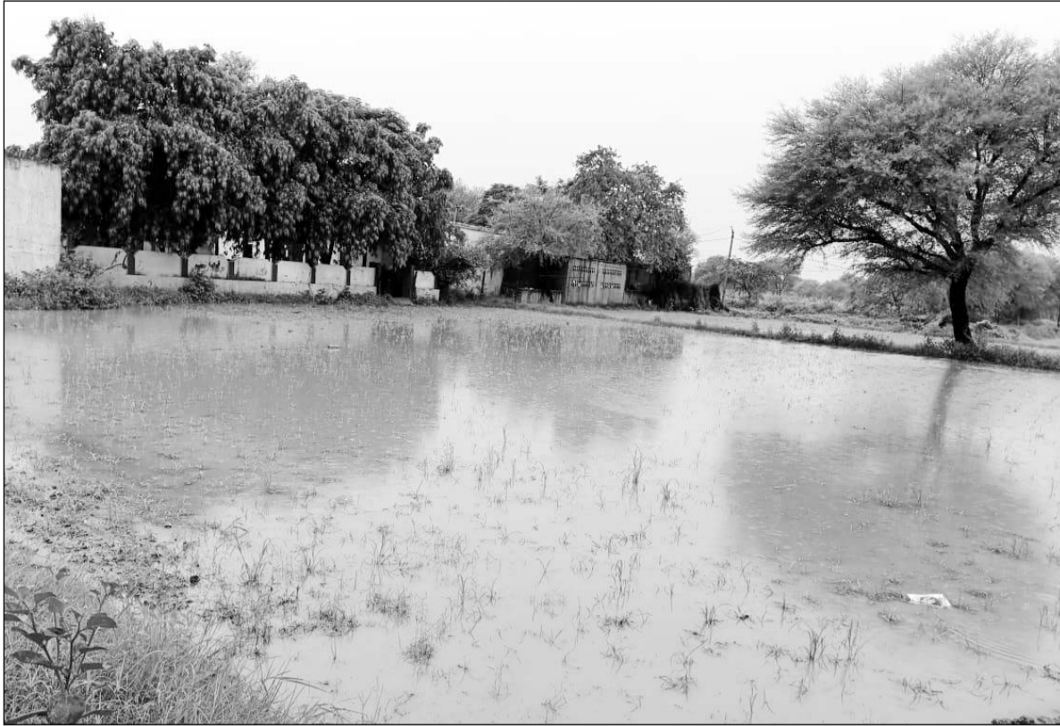
पावटा में मूसलाधार बरसात होने से खेतों में पानी भर गया।

बारिश ने शहर से लेकर देहात तक तबाही मचा दी, गरीबों के कच्चे मकान भी ढह गए