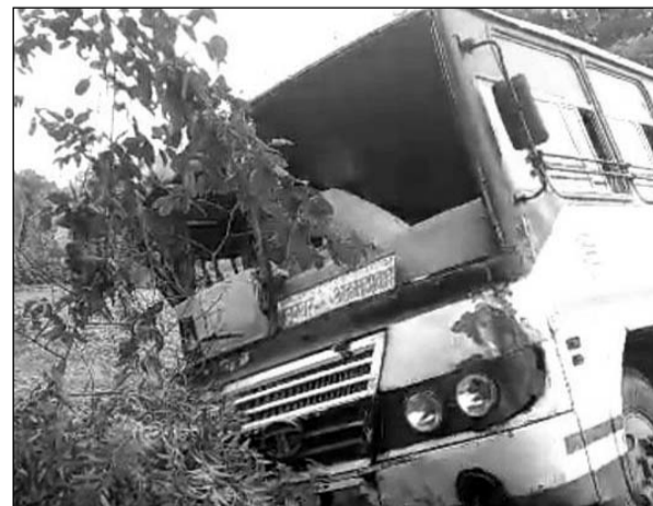
तीजवड मोड़ के पास सड़क किनारे से नीचे उतरी रोडवेज बस।

निकालकर डूंगरपुर अस्पताल लेकर गए, जहां घायलों का इलाज करवाया