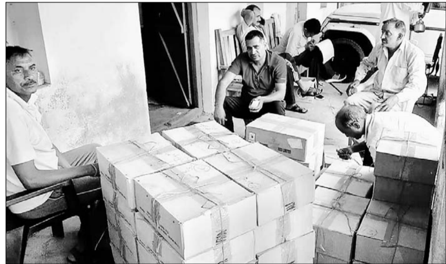
बयाना में जयपुर से आई आबकारी विभाग की स्पेशल टीम ने गेस्ट हाउस से अंग्रेजी-देशी शराब जब्त की।

यह गेस्ट हाउस पुलिस चौकी व आबकारी थाने से मात्र तीस कदम की दूरी पर है। इस कार्रवाई को लेकर और सामने बैठे संबंधित विभाग के अधिकारी- कर्मचारियों की कार्यशैली को लेकर लॉगों में तरह-तरह की चर्चाएं रहें। यह शराब इस टीम ने बजरिया मार्केट स्थित गेस्ट हाउस पर उसके बगल में स्थित दो अन्य बिल्डिंग से बरामद की। कार्रवाई के समय अवैध शराब के कारोबार में लिप्त शराब माफिया मौके का लाभ उठाकर भागने में सफल रहे। आबकारी विभाग की इस छापामार