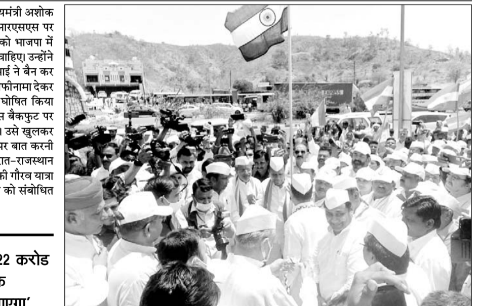
रतनपुर बॉर्डर पर आजादी की गौरव यात्रा व डांडी यात्रा का स्वागत किया, इस दौरान कई कांग्रेस नेता व कार्यकर्ता मौजूद रहे।

डुंगरपुर, (निस)। राजस्थान के मुख्यमंत्री अशोक गहलोत ने राष्ट्रीय स्वयंसेवक संघ आरएसएस पर वार करते हुए कहा कि आरएसएस को भाजपा में मर्ज कर स्पष्ट राजनीति में उतर जाना चाहिए। उन्होंने कहा कि भाजपा को सरदार वल्लभभाई ने बैन कर दिया था जिसके बाद आरएसएस ने माफिनामा देकर आरएसएस को सांस्कृतिक संगठन घोषित किया था। मुख्यमंत्री ने कहा कि आरएसएस बैकफुट पर रहकर भाजपा के लिए काम करता है। उसे खुलकर राजनीति में आना चाहिए और मुद्दों पर बात करनी चाहिए। शुक्रवार को डुंगरपुर में गुजरात-राजस्थान की सीमा रतनपुर बॉर्डर पर आजादी की गौरव यात्रा डांडी यात्रा के स्वागत के दौरान सभा को संबोधित करते गहलोत ने यह बात कही।