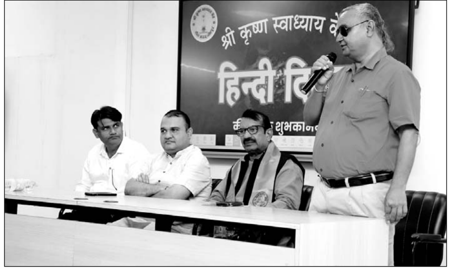
राजस्थान दिव्यांग सेवा समिति जोधपुर द्वारा संचालित श्री कृष्ण स्वाध्याय केंद्र गीता भवन में हिंदी भाषा की संवैधानिक स्थिति पर चर्चा एवं काव्य पाठ का कार्यक्रम हुआ।

जोधपुर, (नि.सं.)। राजस्थान दिव्यांग सेवा समिति, जोधपुर द्वारा संचालित श्री कृष्ण स्वाध्याय केंद्र गीता भवन में हिंदी दिवस के उपलक्ष्य में हिंदी भाषा की संवैधानिक स्थिति एवं काव्य पाठ का आयोजन किया गया। सर्वप्रथम मां सरस्वती वंदना के साथ दीप प्रज्वलन कर कार्यक्रम का आगाज किया गया।