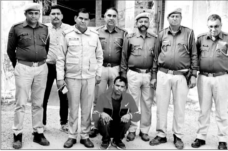
युवक की हत्या के मामले में शाहपुरा पुलिस ने आरोपी को गिरफ्तार किया।