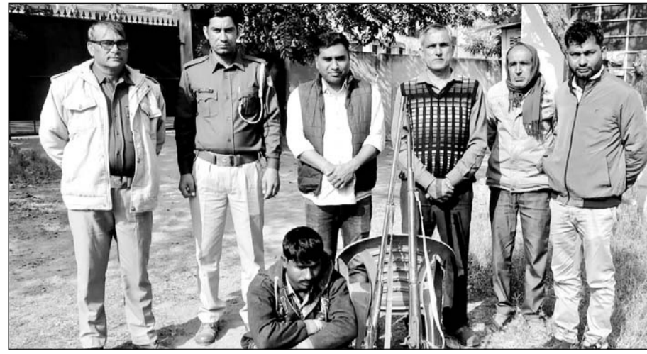
वन विभाग की टीम ने नील गाय का शिकार करने वाले शिकारी को गिरफ्तार किया।

खेतड़ी, (निसं)। खेतड़ी उपखंड के नंगली सलेदी सिंह ग्राम पंचायत क्षेत्र में वन विभाग की टीम ने कार्रवाई करते हुए नील गाय का शिकार करने वाले शिकारी को गिरफ्तार किया है। इस दौरान वन विभाग की टीम ने आरोपी के कब्जे से दो बंदूकें भी जब्त की हैं।