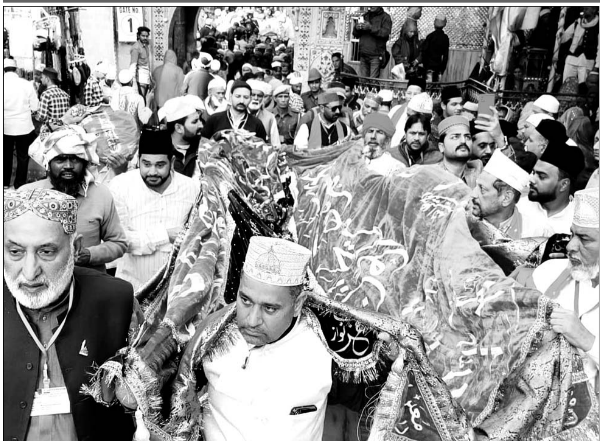
पाकिस्तानी जायरीन की ओर से मखमली चादर और अकीदत के फूल पेश किए गये।

पाकिस्तानी जायरीन ने दोनों मुल्कों के आपसी रिश्तों के लिए दुआ मांगी