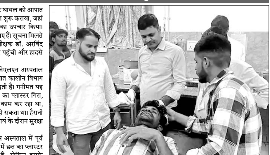
घायल मजदूर का इलाज करते चिकित्सक।

मालूम हो कि जेएलएन अस्पताल में पूर्व में भी कई वाडों सहित पोच में छत का प्लास्टर गिरने से हादसे हो चुके हैं, लेकिन इसके बावजूद भी अस्पताल प्रशासन ने अभी तक कोई सुध नहीं ली है।