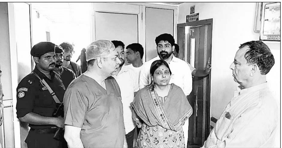
भाजपा हरियाणा प्रभारी एवं भाजपा राजस्थान पूर्व प्रदेश अध्यक्ष डॉ. सतीश पूनिया का मंगलवार देर रात को रोहतक (हरियाणा) में अपेंडिक्स का सफल ऑपरेशन हुआ।

रोहतक। विश्व के लोकप्रिय नेता प्रधानमंत्री नरेन्द्र मोदी के कुशल नेतृत्व में हरियाणा विधानसभा चुनाव में भाजपा के विजय संकल्प अभियान में