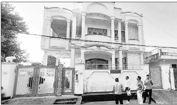
कोटा संभागीय आयुक्त राजेन्द्र विजय का टॉक रोड स्थित मकान।