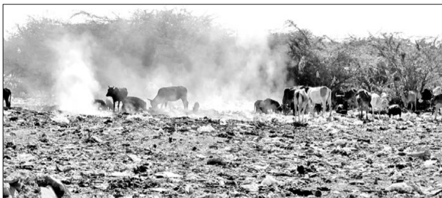
कस्बे के करेडा रोड स्थित खुले डंपिंग यार्ड में लगा आवागमनियों का जमावड़ा।

ओर चार दीवारी नहीं होने के कारण कचरा एवं पॉलिथीन की थैलियाँ फैल कर आस-पास के घरों में तथा करेडा रोड सड़क मार्ग पर गंदगी फैला रही है। और दिन-रात कचरे की दुर्गंध से आस-पास की आबादी के लोगों के स्वास्थ्य पर बुरा प्रभाव पड़ रहा है। डंपिंग यार्ड के आस-पास गायों व आवागमनियों का जमावड़ा लगा रहता है। ग्रामीणों द्वारा कई बार प्रशासन को अवगत करने के बावजूद भी समस्या का समाधान नहीं