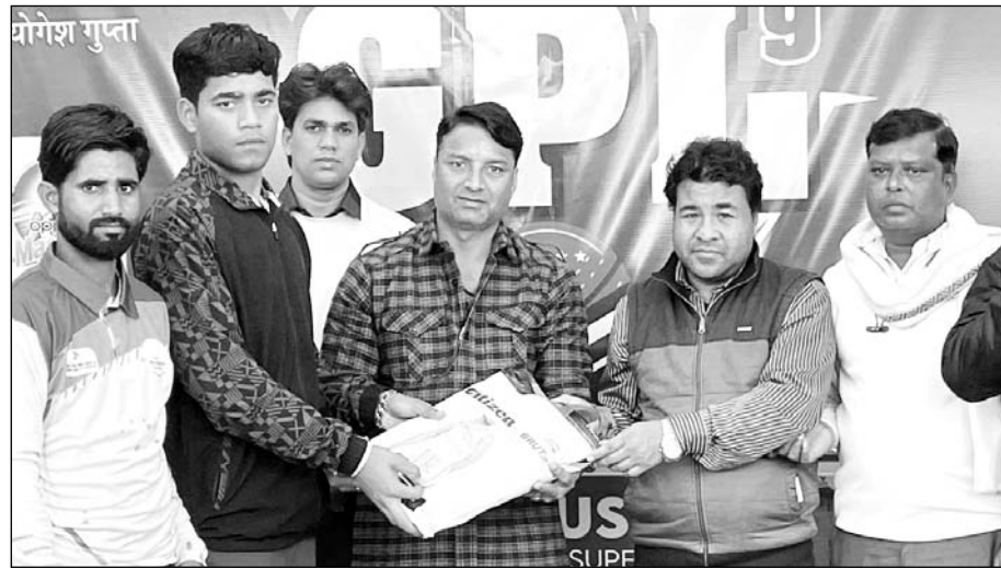
खिलाड़ियों का सम्मान करते अतिथी।

गंगापूर सिटी, (निर्स)। पीयूष जीपीएल 9 के रिवार को हुए रोमांचक मुकाबलों में डीएस साइंस एकेडमी और जीजीसी हंटर्स ने जीत अपने नाम दर्ज कराई। हायर सेकेंडरी स्कूल के खेल मैदान में चल रही जीपीएल 9 क्रिकेट प्रतियोगिता में पहला मुकाबला ओपो मास्टर ब्लास्टर और डीएस साइंस एकेडमी के बीच खेला गया।