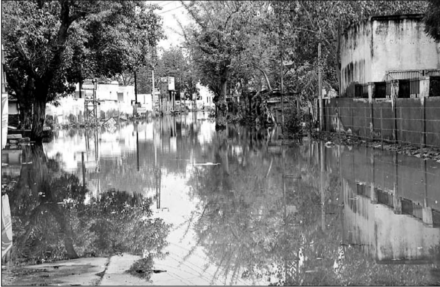
चूरु शहर में डाक बंगले के पास टाऊन हॉल की गली में बारिश के पानी ने नदी का रूप धारण कर लिया जिससे लोगों को अपने घरों से बाहर निकलना मुश्किल हो गया।

जानकारी के अनुसार सोमवार शाम को बारिश का दौर शुरू हुआ जो कि करीब एक घंटे तक चला। इसके बाद रात को करीब नौ बजे फिर से बारिश का दौर शुरू हुआ जो कि रातभर रुक रुक कर चलता रहा। रिमझिम बारिश के कारण मौसम सुहावना हो गया। लोगों को भयंकर गर्मी से निजात भी मिल गयी और किसानों के चेहरे खिल उठे। लेकिन शहरवासियों के लिए बारिश परेशानी का सबब बन गई जहां पर पानी भराव की समस्या आज से नहीं बरसों से चली आ रही है। बारिश के कारण मुख्य बाजार सुभाष चौक, झारिया मोरी, नेत्र चिकित्सालय, राजकीय भारतीय अस्पताल, डाक बंगले के पास, पंचायत समिति, चांदनी चौक आदि अनेक स्थानों पर पानी भर गया। जिससे लोगों को काफी परेशानी का सामना करना पड़ रहा है।