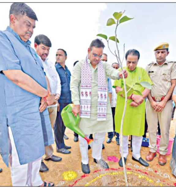
मुख्यमंत्री भजनलाल शर्मा ने शूक्रवार को विश्व पर्यावरण दिवस पर झालाना के विश्व वानिकी वृक्ष उद्यान में बरगद का पौधा रोपकर 'हरियालो राजस्थान' और 'एक पेड़ मां के नाम' अभियान का शुभारंभ किया।

-कार्यालय संवाददाता- जयपुर। मुख्यमंत्री भजनलाल शर्मा ने कहा कि प्रदेशवासी प्रकृति के संरक्षण में सक्रिय भूमिका निभाएं और राज्य को हरित, स्वच्छ और जल संपन्न बनाने में योगदान दें।