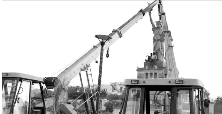
सेवन वंडर पार्क से क्रैन की मदद से स्टेच्यू ऑफ लिबर्टी को हटाया।

अजमेर, (कासं)। सुप्रीम कोर्ट के सख्त रुख के बाद सोमवार को स्थानीय प्रशासन हरकत में आ गया। वेदलैंड स्मार्ट सिटी प्रोजेक्ट के तहत करोड़ों रुपए की लागत से बने सेवन वंडर पार्क से क्रैन की मदद से स्टेच्यू ऑफ लिबर्टी को हटाना शुरू कर दिया है। इससे पहले नगर निगम ने फूड कोर्ट में फर्श और गांधी स्मृति उद्यान में बने पाथ-वे पर जेसीबी का पीला पंजा चलाया। यहां उल्लेखनीय है कि सुप्रीम कोर्ट ने राज्य सरकार व जिला प्रशासन से सवाल किया था कि आनासागर झील के भराव क्षेत्र में हुए अतिक्रमणों को अब तक क्यों नहीं हटाया गया। 9 मार्च को सेवन वंडर पार्क के मुख्य द्वार पर ताला लगा दिया, जिससे पर्यटकों का प्रवेश बंद हो गया था।