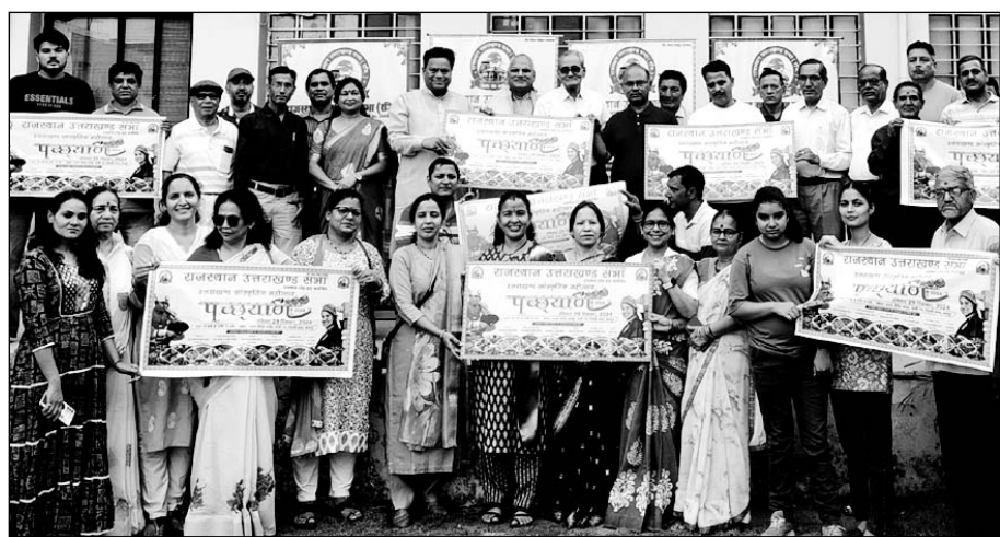
राजस्थान उत्तराखंड सभा राजस्थान प्रदेश द्वारा चौथे संस्करण "पच्छ्याण" कार्यक्रम के पोस्टर का विमोचन हुआ।