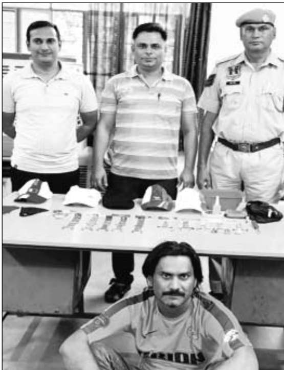
सोडाला थाना पुलिस ने एटीएम से छेड़छाड़ करके लोगों के रुपये निकालने वाले एक युवक को गिरफ्तार किया है।