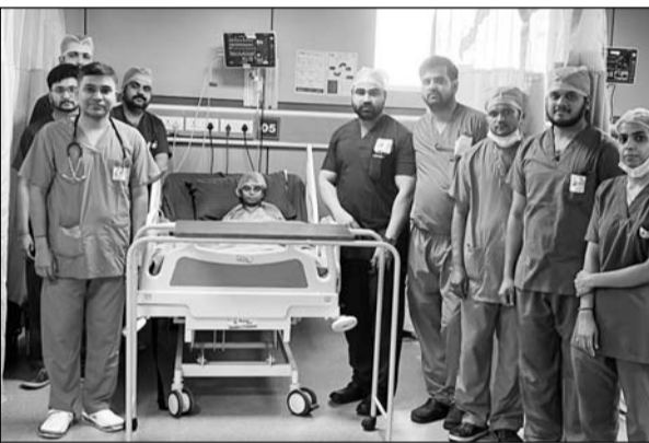
उदयपुर में पिम्स हॉस्पिटल में कार्डियोलॉजिस्ट की मदद से बिना ओपन हार्ट सर्जरी के हृदय का छेद का सफल उपचार किया।