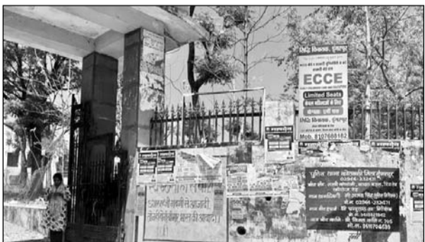
महाविद्यालय के बाहर शहर की खूबसूरती बिगाड़ने वाले पोस्टर, स्टीकर और बैनर लगे।