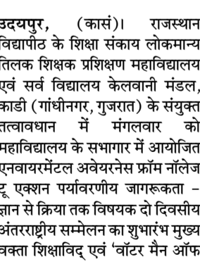
'लोकमान्य शिक्षक' के भाषा, शिक्षा और संस्कृति विशेषांक का विमोचन किया।