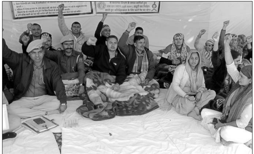
जोधपुर सेंट्रल जेल के बाहर जेल प्रहरियों ने प्रदर्शन किया।

एम.जी.एच. में भर्ती कराए एक अनशनकारी का ऑक्सीजन लेवल कम होने पर उपचार किया