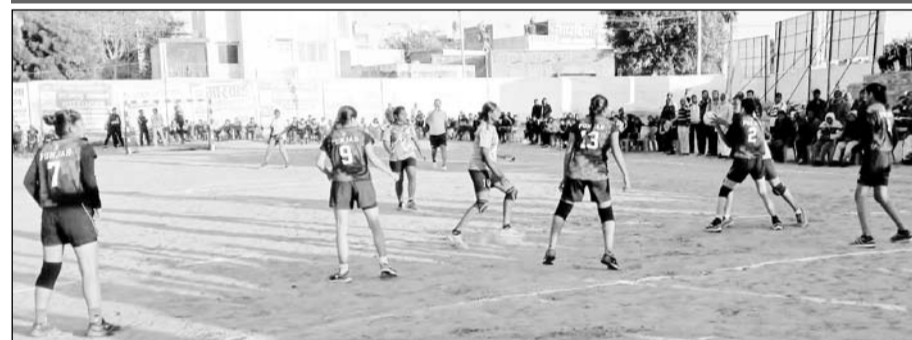
मिर्धा पार्क में जूनियर हैंडबॉल प्रतियोगिता में प्रदर्शन करती छात्राएं।