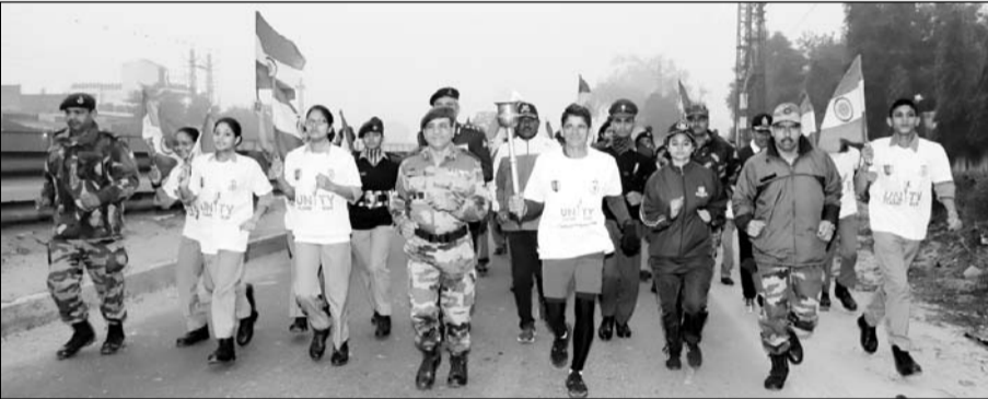
तीन हजार किलोमीटर की दौड़ पूरी कर धौलपुर पहुंची यूनिटी फ्लेम रन टीम को रवाना किया।