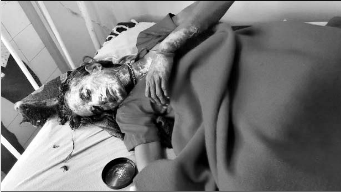
एसिड अटैक में घायल महिला का अस्पताल में उपचार जारी है।