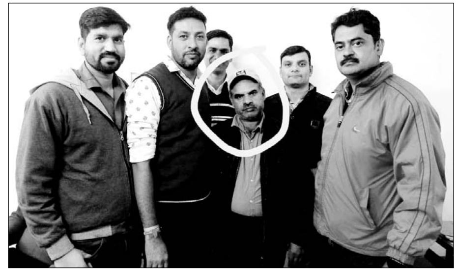
एसीबी की उदयपुर यूनिट ने आरोपी (गोल घेरे में) को गिरफ्तार किया।