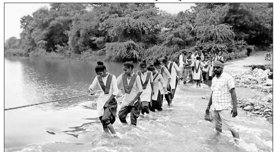
बच्चों और बुजुर्गों को ग्रामीण जन रस्सी के सहारे पीठ पर सवार करके नाला पार कराते हैं।