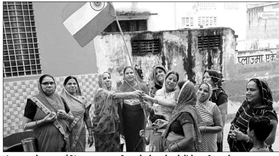
चंद्रयान-3 के सफल लैंडिंग पर भाजपा महिला मोर्चा कार्यकर्ताओं ने खुशी जताई।