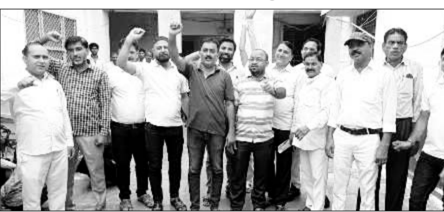
करौली के सामान्य चिकित्सालय में अपनी मांगों को लेकर नर्सिंज कर्मियों ने प्रदर्शन किया।

करौली। राजस्थान नर्सिंज संयुक्त संघर्ष समिति के प्रांतीय आह्वान पर करौली जिले से सैकड़ों नर्सिंज 25 अगस्त को जयपुर प्रस्थान करेंगे। गत 18 जुलाई से नर्सिंज अपनी 11 सूत्रीय मांगों जिसमें वेतन विसंगति दूर करना, नर्सिंज निदेशालय की