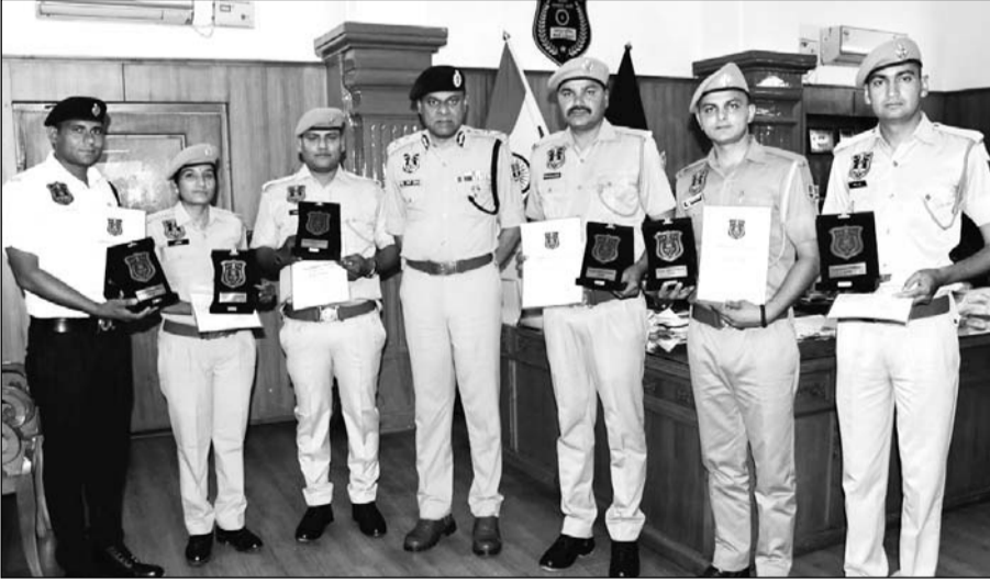
जयपुर पुलिस आयुक्तालय में मंगलवार को पुलिस आयुक्त बीजू जॉर्ज जोसफ ने उत्कृष्ट कार्य करने वाले छह पुलिसकर्मियों को कांस्टेबल ऑफ द मंथ अवार्ड से नवाजा।