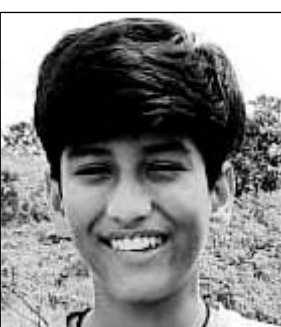
मृतक दोनों दोस्तों के फाइल फोटो।

घटित हो गया। एक छात्र ने तुरंत भाग कर सड़क पर आकर लोगों से सहायता मांगने लगा। देखते ही देखते लोग एकत्रित हो गए तथा दोनों को बाहर निकल लिया, दोनों को तुरंत जिला चिकित्सालय शाहपुरा पहुंचाया गया जहां उपचार के दौरान दोनों ने दम तोड़ दिया। इस दौरान पुलिस भी मौके पर पहुंचकर घटना को जानकारी ली।