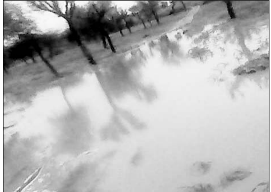
सादुलपुर में मूसलाधार वर्षा के चलते खेतों में भरा पानी।

सादुलपुर, (निसं)। सादुलपुर उपखंड के शहरी एवं ग्रामीण क्षेत्र में मानसून का दौर सक्रिय होने के चलते शनिवार को भाकरा के आसपास गाँवों में तेज मूसलाधार वर्षा हुई। शनिवार अलसुबह मौसम घनघोर घटाएँ छाई रही, बादलों की आवाजाही के बिच