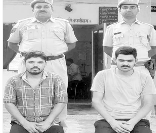
पुलिस की गिरफ्त में दुष्कर्म के आरोपी।