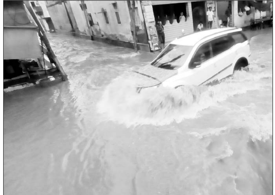
श्रीमाधोपुर में हुई मूसलाधार बारिश से निचले इलाकों व दुकानों में पानी भर गया।

श्रीमाधोपुर, (निसं)। कस्बे में 3 घंटे तक लगातार मूसलाधार बारिश सहित सुबह 8 बजे से लेकर 5 बजे तक साढ़े 3 इंच (85 एमएम) वर्षा दर्ज हुई। श्रीमाधोपुर खंडेला बाजार में घना नाला बहने से आमजन रुक सा गया जो करीब 2 घंटे तक आवागमन