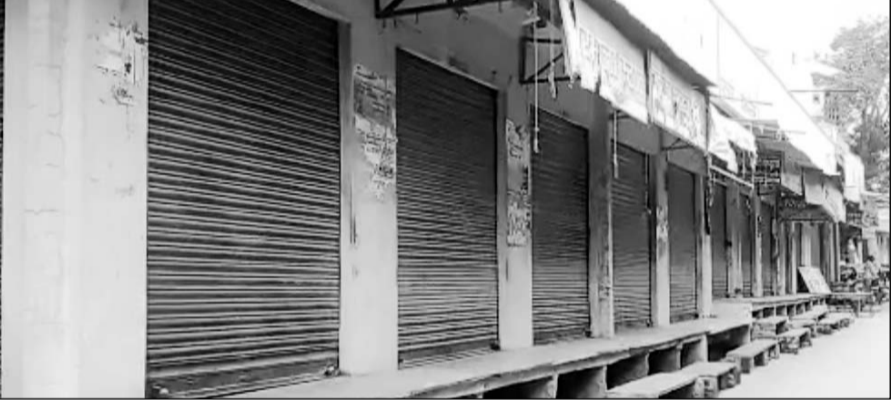
मांडल थाना क्षेत्र में तनाव की स्थिति के दौरान बाजार बंद रहा।

भीलवाड़ा, (निसं)। मांडल थाना क्षेत्र में भगवान की सवारी के दौरान डीजे साउंड बंद करने को लेकर दो समुदायों में विवाद हो गया और दोनों समुदाय के लोग आमने-सामने हो गए, जिससे तनाव की स्थिति बन गई। पुलिस ने कानून व्यवस्था कायम रखने के लिए अतिरिक्त सुरक्षा बल तैनात किया गया है। भीलवाड़ा के मांडल कस्बे में एकादशमी से पूर्व दशमी को परंपरागत तरीके से शोषणहाय धाम बड़ा मंदिर से भगवान चारभुजा नाथ का बेवाण निकलता है, जो की भजन कीर्तन के साथ निधत्त मार्ग से होते हुए पुनः बड़ा मंदिर पहुंचता है। कस्बे में हसन हुसैन के ताजिया भी निकलने वाले थे। वहीं,