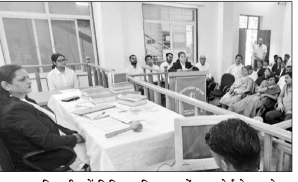
राजस्थान विद्यापीठ में विधि महाविद्यालय में मूट कोर्ट के आयोजन के दौरान विद्यार्थियों ने न्यायिक प्रक्रिया की झलक प्रस्तुत की।

उदयपुर, (कास)। विधि शिक्षा को व्यावहारिक स्वरूप प्रदान करने के उद्देश्य से राजस्थान विद्यापीठ के संघटक विधि संकाय के विद्यार्थियों को ओर से मूट कोर्ट का आयोजन किया गया जिसमें मेडिकल ग्रांस नेल्सोनेस के एक महत्वपूर्ण मामले पर सुनवाई हुई, जिसमें हॉस्पिटल मैनेजमेंट के गंभीर लापरवाही के लिए जिम्मेदार ठहराया गया। इस दौरान विद्यार्थियों ने