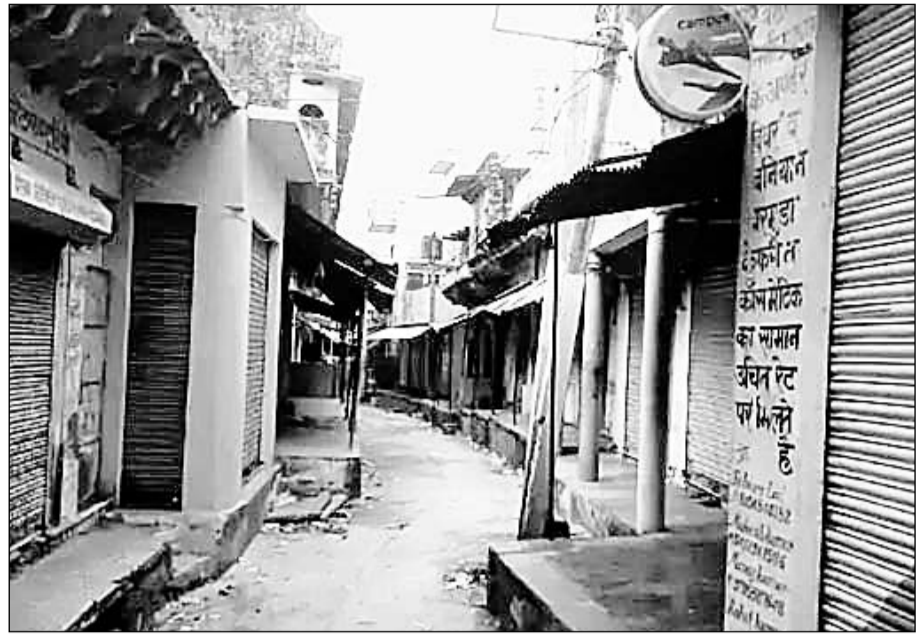
अलवर के रामगढ़ कस्बे में घटना के विरोध में बाजार बंद रहे।

अलवर, (निसं)। अलवर के रामगढ़ में अलावड़ा रोड पर चार दिन पहले मिलकपुर गांव के पूर्व ग्रंथी के बाल काटने के मामले में आमजन का गुस्सा अभी शांत नहीं हुआ है।