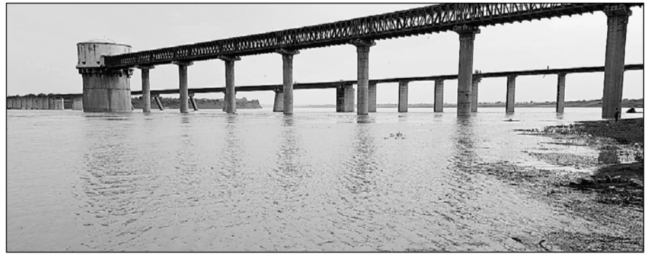
धौलपुर के पास से चम्बल नदी का लिया गया विहंगम दृश्य।