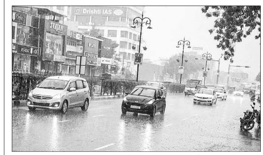
जयपुर में दोपहर बाद काली घटाएं घिर आईं और तेज बर्षा होने लगी। इस दौरान सड़कों पर पानी भर गया और वाहन चालकों को भारी परेशानी का सामना करना पड़ा। वहीं भारी टंड की वजह से लोग घरों में दुबकने को मजबूर हो गये।

रखते हैं उन्हें ऐसा नहीं करना चाहिए। संघ की विचारधारा किसी व्यक्ति विशेष या परिवार विशेष के लिए नहीं है। आरएसएस हमारी संस्कृति, हमारे नैतिक मूल्यों, हमारी सभ्यता और हमारे आदर्शों को महत्व देता है और इनके संवर्धन के लिए कार्य करता है। राहुल गांधी को देश को मजबूत बनाने वाली, भारत को आत्मनिर्भर बनाने वाली बातें करनी चाहिए थीं, लेकिन उनका भारत से संघर्ष करने का बयान देना, पूर्ण रूप से निंदनीय है।