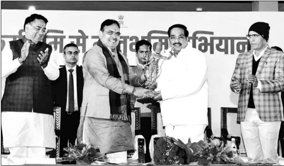
कर्मभूमि से मातृभूमि अभियान के अंतर्गत सांगानेर में मुख्यमंत्री भजनलाल शर्मा ने केन्द्रीय जलशक्ति मंत्री सी.आर. पाटिल का स्वागत किया।

जयपुर। केन्द्रीय जलशक्ति मंत्री सी. आर. पाटिल ने कहा है कि वह दिन दूर नहीं जब प्रधानमंत्री नरेन्द्र मोदी के नेतृत्व में राजस्थान सबसे अधिक पानी वाला राज्य होगा। उन्होंने कहा कि प्रधानमंत्री नरेन्द्र मोदी के नेतृत्व में केन्द्र सरकार और मुख्यमंत्री भजनलाल शर्मा के नेतृत्व में राज्य सरकार ने प्रदेश को जल आत्मनिर्भर बनाने के लिए महत्वपूर्ण प्रयास किए हैं। उन्होंने कहा कि आमजन भी जल की एक-एक बूंद के महत्व को समझते हुए जल संचय में जुड़े, इस उद्देश्य से शुरू किया गया कर्मभूमि से मातृभूमि अभियान अब एक जन आंदोलन का रूप लेता जा रहा है।