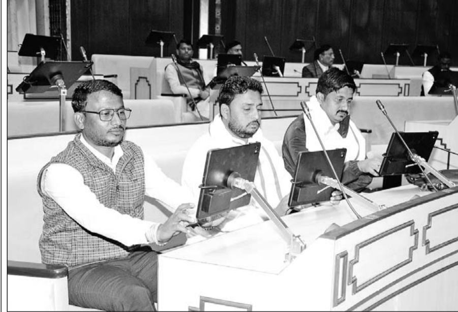
विधानसभा के सदन में आयोजित समारोह में लगभग एक सौ दस विधायकों ने बुधवार को आइपेड के माध्यम से एक दिवसीय प्रशिक्षण लिया।

■ 'तकनीकी युग की आवश्यकता अनुसार राजस्थान विधानसभा को बनाया जा रहा है पेपरलेस'