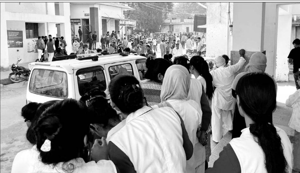
परिजनों द्वारा चिकित्साकर्मों से मारपीट करने के बाद अस्पताल में प्रदर्शन करते चिकित्साकर्मों।