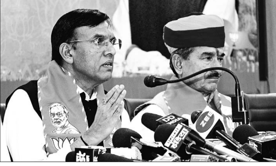
केंद्रीय श्रम एवं रोजगार, युवा कार्यक्रम एवं खेल मंत्री डॉ. मनसुख मांडविया ने भाजपा प्रदेश कार्यालय में प्रेसवार्ता को संबोधित किया। इस दौरान प्रदेशाध्यक्ष मदन राठौड़ भी मौजूद थे।

मांडविया ने कहा कि 1985 में राजीव गांधी ने 21वीं सदी की बात कही थी, लेकिन बिना कार्य योजना या फिर रोडमैप के उनका सपना सपना ही रह गया। वहीं दूसरी ओर प्रधानमंत्री नरेंद्र मोदी ने 2022 में लाल किले से देश के सामने विकसित भारत 2047 के सपने को रखा और इसे साकार करने के लिए रोडमैप भी बताया। उन्होंने कहा कि देशवासियों को पांच संकल्प लेने चाहिए। इसमें गुलामी की प्रतिकों का त्याग करने, विरासत से प्रेरणा लेने, देश के प्रत्येक नागरिक के साथ कदम से कदम मिलाकर आगे बढ़ने, सामाजिक-आर्थिक सुरक्षा का माहौल देने और राष्ट्र प्रथम की भावना से कार्य करने के लिए प्रेरित किया।