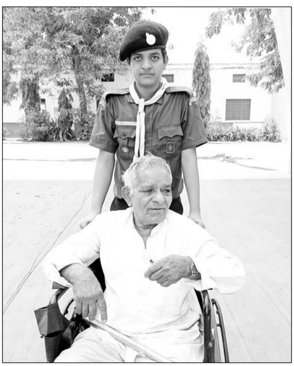
स्काउट गाइड के वॉलियंटर्स बृद्ध व विकलांग मतदाताओं को व्हील चेयर पर बूथ तक लाये।